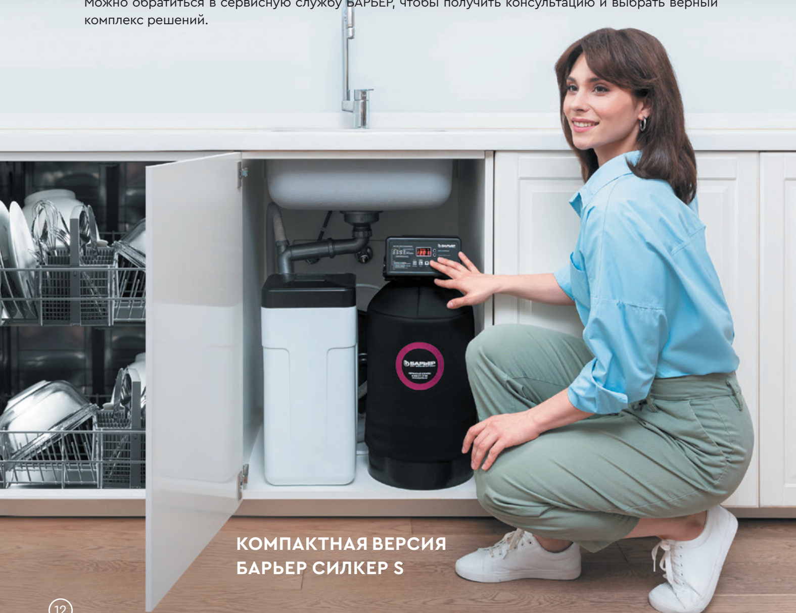
КОМПАКТНАЯ ВЕРСИЯ БАРЬЕР СИЛКЕР S

Можно обратиться в сервисную службу БАРЬЕР, чтобы получить консультацию и выбрать верный комплекс решений.